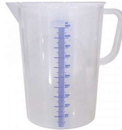
Gambar 7. Gelas ukur.