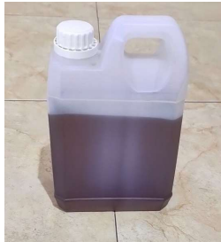
Gambar 2. Resin unsaturated polyester.