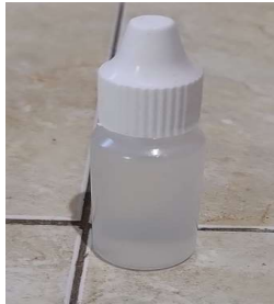
Gambar 3. Katalis.