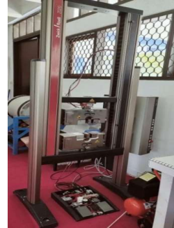
Gambar 4. Mesin uji tarik (Zwick Roell).