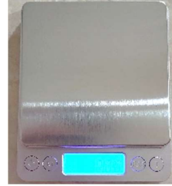
Gambar 5. Timbangan digital.